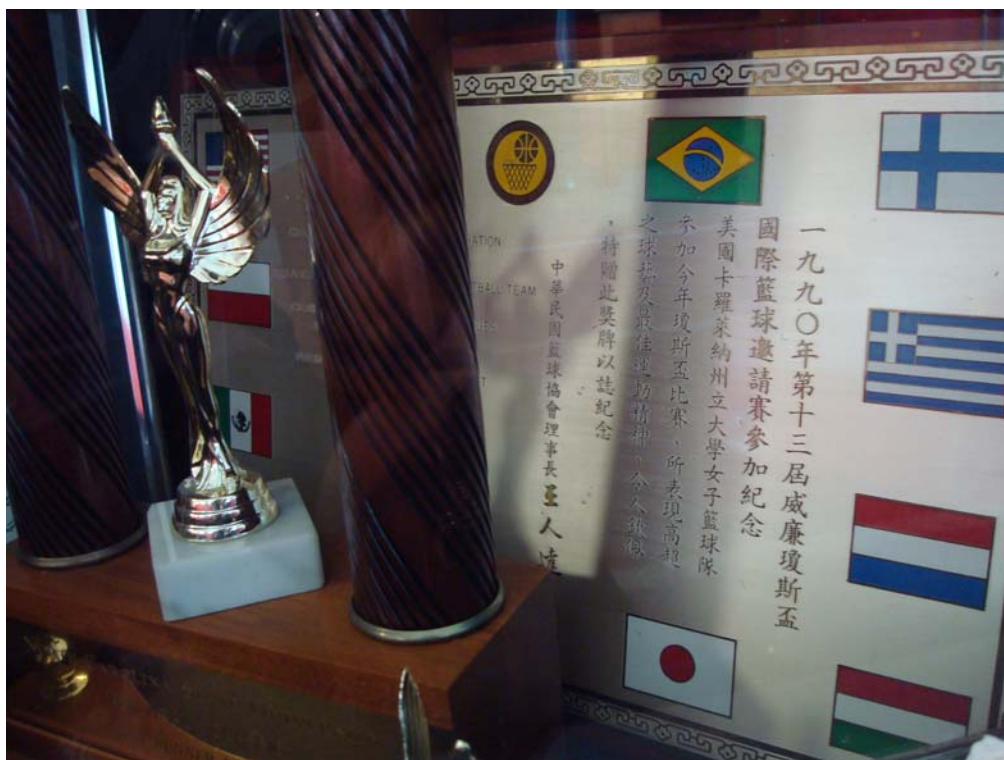
北卡女籃曾受邀參加 1990 第十三屆威廉瓊斯盃籃球邀請賽。